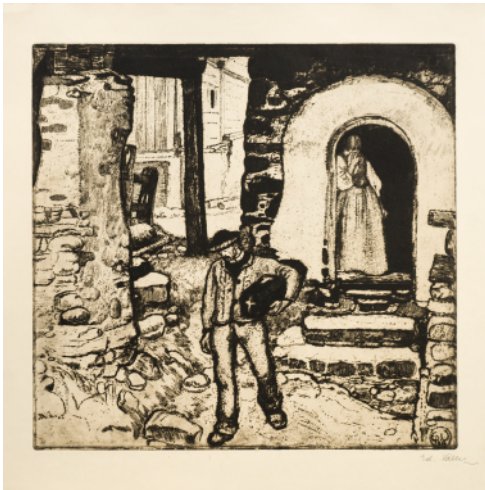
 douard Vallet, L'enfant mort , 1914, Eau-forte sur cuivre, 39 x 40,7 cm, collection priv e