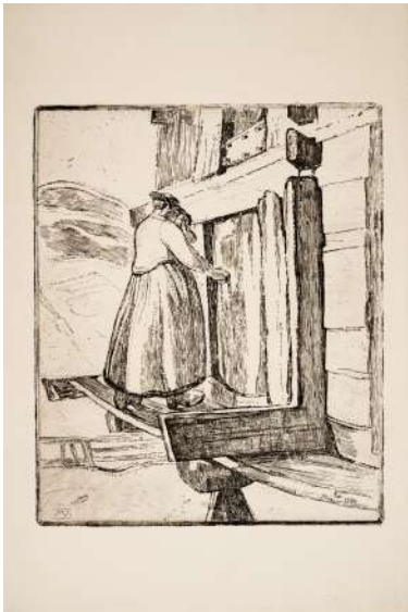
Marguerite Vallet-Gilliard, Montagnarde , s.d., eau-forte, 35,5 x 40,5 cm, collection priv e

Connue et reconnue de son vivant, Marguerite Vallet-Gilliard est rapidement tomb e dans l'oubli. Malgr  les hommages  logieux sur sa courte carri re et son talent ind niable, sa vie et son  uvre n'ont pas connu la notori t  esp r e. Cit e dans les nombreux ouvrages d di s   la carri re de son  poux, son  uvre n'a que rarement  t   tudi e de mani re autonome, du moins avant la premi re exposition monographique qui lui est d di e en  t  2022   la Fondation  douard Vallet. Malgr  sa courte carri re, cette derni re m rite incontestablement aujourd'hui d' tre (re)consid r e, et son  uvre  tudi e.