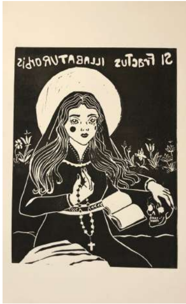
Lyna Beggah, Marie Madeleine , 2023, linogravure, 14,8 x 21 cm