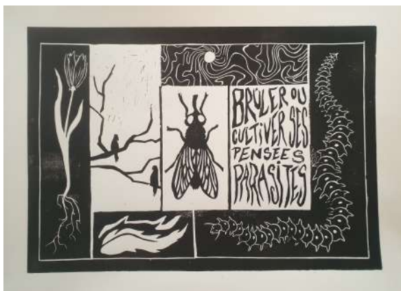
Doman Shekani, Patchwork parasites , 2023, linogravure, 50 x 70 cm

Sa pratique artistique aux caract eristiques narratives explore diff erents m ediums visuels qui  elargissent le d eveloppement de son univers iconographique. La suggestion de moments ou de mondes proches et lointains plonge l'observateur entre le r eel et la r eminiscence imaginaire. Le m elange entre l'analogique et le num erique revient souvent dans sa mani ere de cr eer ses univers fond es sur ce qui l'entoure, oscillant entre repr esentations dystopiques et utopiques.