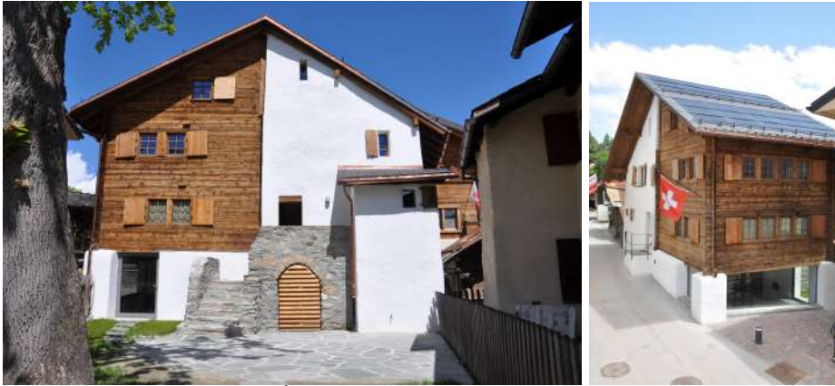
Vues actuelles de la maison d'Édouard Vallet et Marguerite Vallet-Gilliard, acquise en 1912. La maison abrite aujourd'hui la Fondation Édouard Vallet.

fanées, abordant les thématiques essentielles et quotidiennes d'identité, de mémoire, de vie et de mort. La notion de cycle émerge ainsi au cœur de l'exposition, sorte de repère et fil rouge aux créations individuelles et collectives réalisées par les trois artistes émergentes.